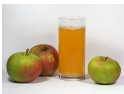
Abbildung 14: Frischgepresster Apfelsaft