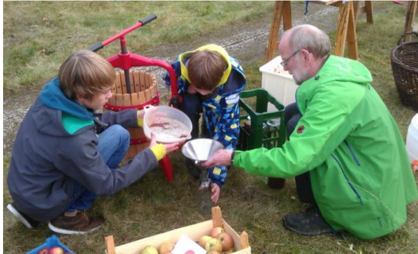
Abbildung 11: Apfelpresse des Lüneburger Streuobstwiesenvereins in Aktion auf dem Apfelfest 2013 in Lüneburg

Für das eigene Pressen werden die Früchte (Äpfel, Birnen, Quitten) mit einem Garten-Häcksler bearbeitet, der mit Messern die Äpfel zerkleinert. Ein manuell betriebener Häcksler geht auch. Die so entstandene Maische wird in einer Korbpresse ausgepresst. Zwischen die Maischeschichten werden „Pressbleche“ aus Kunststoff gelegt, welche den Abfluss des Saftes fördern. Die Ausbeute bei diesem Verfahren liegt, je nach Reifegrad der Früchte, bei bis zu 60 Prozent. Der Pressdruck