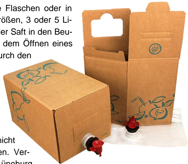
Abbildung 15: Bag in Box-Systeme

Als letztes sei noch eine Aktion des Kulturvereins Küsterscheune Betzendorf genannt. Hier haben sich einige Interessierte zusammengeschlossen und eine komplette Saftungsanlage (Häcksler, Presse, Pasteurisateur etc.) gekauft. Jeweils im Herbst zu verschiedenen Zeiten können Privatleute dort unter tatkräftiger Mithilfe mosten. 9