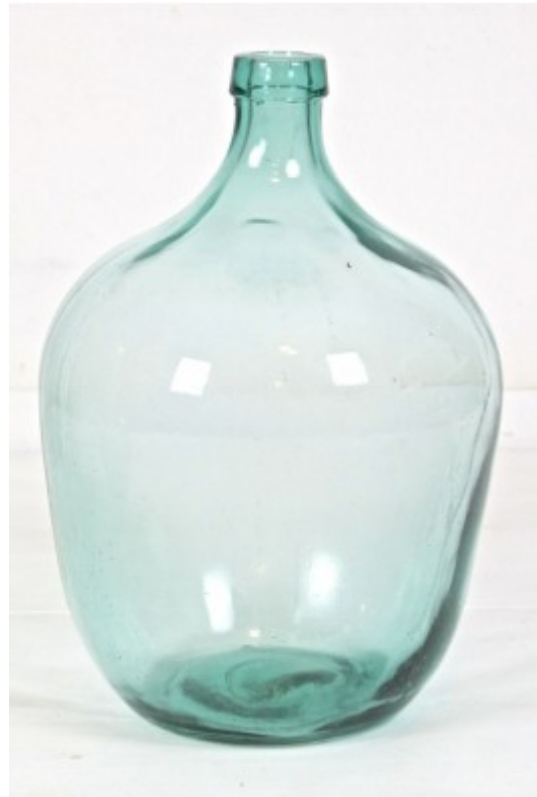
Abbildung 19: Ballonflasche zur Weinherstellung