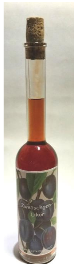
Abbildung 21: Flasche mit selbsterstelltem Etikett