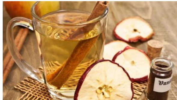
Abbildung 8: Apfeltee

Früchtetees werden als „Tee“ bezeichnet, sind aber markenrechtlich „teeähnliche Erzeugnisse“. Es sind aromatische Getränke aus getrockneten Pflanzenteilen, wie Früchten oder Fruchtteilen von Äpfeln oder Hagebutten oder auch Blättern und Blüten. 1