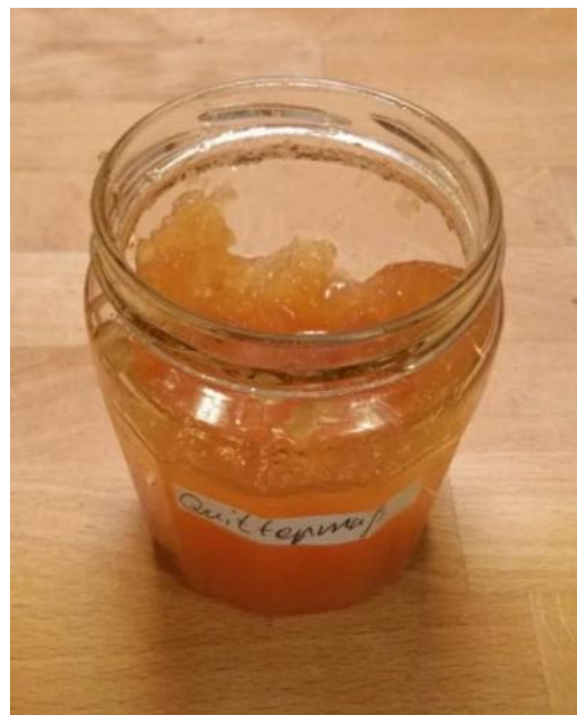
Abbildung 10: Quittenmus als Brotaufstrich

Zunächst werden die Quitten gewaschen um den samtigen Pelz zu entfernen. Dann mit einem Kartoffelschäler die Schale entfernen. Die harten Quitten danach vierteln und das Kernhaus herausschneiden (Achtung: Verletzungsgefahr). Die Viertel werden dann in ca. Walnuss große Stücke zerkleinert. Die Quittenstücke mit etwas Wasser kochen, bis sie weich sind. Der grobe Brei wird anschließend durch ein Sieb gedrückt oder durch die flote Lotte gedreht. Danach den Quittenbrei mit normalem Zucker 1:1 aufkochen, bis es geliert (Achtung: Quitten gelieren sehr gut). Eventuell mit etwas Ingwer würzen. In saubere Gläser heiß abfüllen und mit Twist-Off Deckeln verschließen. Die Verwendung einer Obstmühle und eines Entsafters zur Herstellung von Quittengelee ist auch eine häufig verwendete Variante.