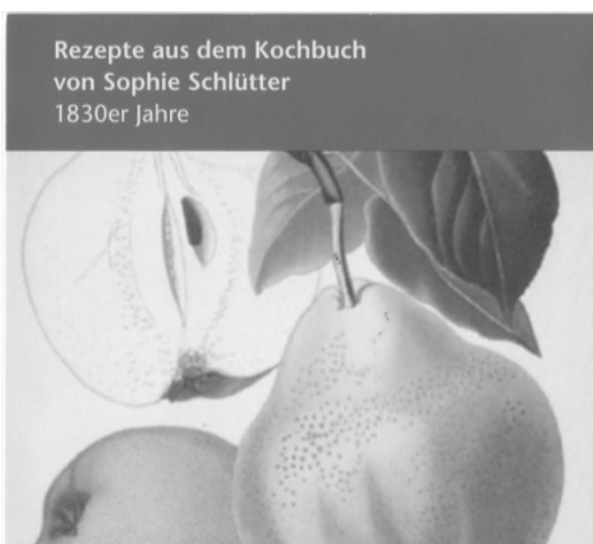
Rezepte aus dem Kochbuch von Sophie Schlütter 1830er Jahre