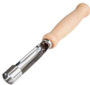
Abbildung 6: Einfacher Kernhausausstecher mit Holzgriff

Früchte zur Verfügung (z.B. Kirschen, Zwetschgen, Birnen und Äpfel).