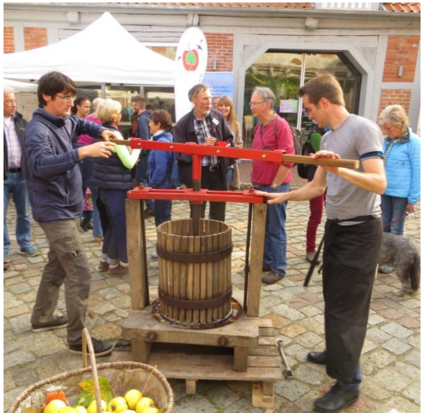
Abbildung 13: Apfelsaftpresse in Aktion auf dem Apfefest 2015 des Lüneburger Streuobstwiesenvereins in Bleckede

Der Saft wird aufgefangen und kann nun sofort getrunken oder weiter verarbeitet werden. Soll es