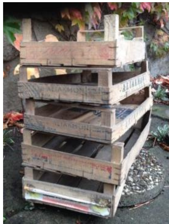
Abbildung 2: Obstlagerung in alten Obstkisten

Einige Sorten erreichen erst im Lager ihre Genussreife (z.B. Ontario). Direkt vom Baum gepflückt enthalten sie zu viel Säure und sind nicht für jeden genießbar. Im Lager baut sich die Säure langsam ab und die Süße und andere Aromen treten in den Vordergrund.