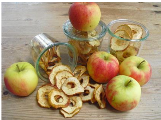
Abbildung 7: Fertige Apfelringe