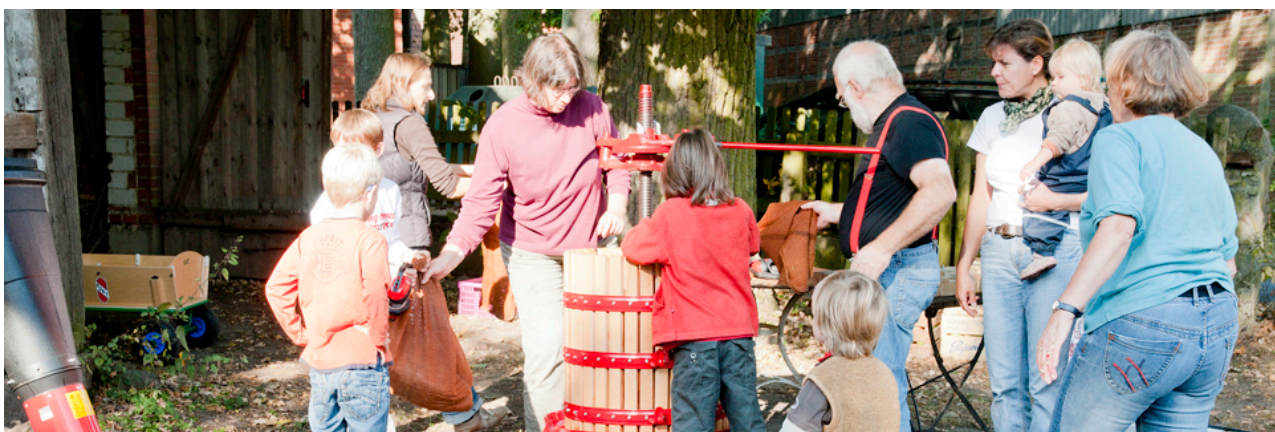
Abbildung 16: Safterstellung für die ganze Familie in der Küsterscheune Betzendorf