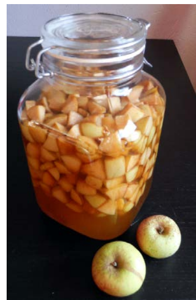
Abbildung 20: Apfellikör Herstellung in kaltem Entzug

Liköre aus Obst können hervorragend selber hergestellt werden. Zucker und Alkohol wird zugeführt, der Geschmack kommt aus den Früchten. Es gibt verschiedene Verfahren einen Likör herzustellen. Es gibt die heiße und die kalte Herstellung. Bei der heißen Herstellung wird eine Mischung aus Zucker, Früchten und Gewürzen erhitzt und auf diesem Weg den Früchten das Aroma und den Farbstoff zu entziehen. Bei der kalten Herstellung erfolgt der Entzug dieser Stoffe über den Alkohol nach mehreren Wochen von selbst.