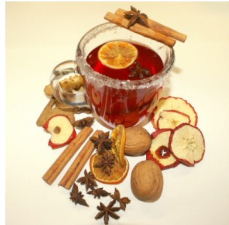
Abbildung 17: Apfelpunsch mit allerlei Gewürzen

Frisch gepressten Apfelsaft (alternativ auch schon pasteurisierten Saft) auf ca. 80 Grad erhitzen. In der Weihnachtszeit passen die Gewürze, die bei der Likörherstellung verwendet werden (s.u.), gut dazu.