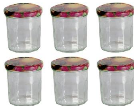
Abbildung 5: Im Handel erhältliche Twist-Off Gläser

Die getrockneten Früchte eignen sich zum direkten Verzehr als gesunder Snack statt Chips & Co., können aber auch zerkleinert im Müsli verwendet werden.