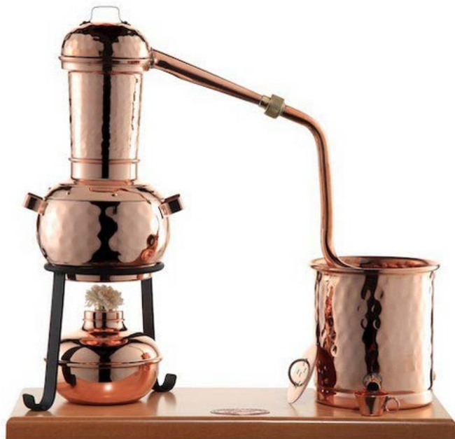
Abbildung 24: In Deutschland zugelassene Destille mit einem Volumen von 0,5 L