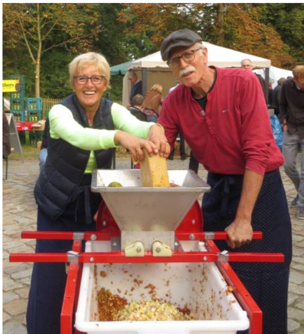
Abbildung 12: Apfelmühle zur Herstellung der Maische hier auf dem Apfelfest des Lüneburger Streuobstwiesenvereins 2015 in Bleckede

Apfelsaft ist in Deutschland sehr beliebt. 2014 betrug in Deutschland der Pro-Kopf-Verbrauch an Apfelsaft und Apfelsaftschorle jeweils 7,9 Liter. 7 Wie Apfelsaft großindustriell hergestellt wird, zeigt der Film „Vom Baum in die Flasche - Die