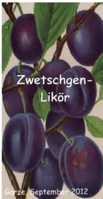
Abbildung 22: Selbstgestaltetes Etikett für die Likörfaschen

Tip: In der Obstsortendatenbank einer Internetseite des BUND-Lemgo finden sich viele historische Abbildungen von Früchten aus alten Pomologien. Diese Grafiken eignen sich hervorragend als Hintergrund für Etiketten.