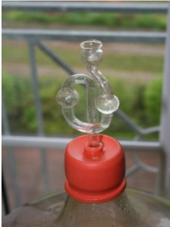
Abbildung 18: Gärröhrchen zum luftdichten Verschluss der Ballonflasche

Der gewonnene Apfelsaft wird unter Zusatz von Reinzuchthefen und unter Luftabschluss (Gärröhrchen) vergoren. Er entspricht im Geschmack einem hessischen Moscht oder ähnelt einem französischen Cidre. Nach einem ersten Abzug von der Hefe, die sich am Grund abgesetzt hat, bleibt der Wein in einem zweiten Ballon zur ersten Klärung. Nach 4 Wochen erfolgt ein Abzug auf Flaschen. Je länger der Wein dunkel gelagert wird, umso klarer und geschmackvoller wird er. Kann auch mit Wasser verdünnt werden und ist dann im Sommer eine herrliche Erfrischung. Näheres dazu unter „Kitzinger Weinherstellung“ im Internet. 10/11