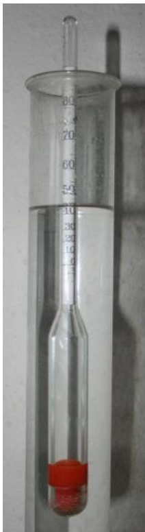
Abbildung 23: Aräometer oder Alkoholmessspindel

Zur Herstellung der Obstmaische wird das Obst grob gemahlen bzw. fein gehäckselt und in großen offenen Behältern abgefüllt. Beim Maischen wird der Fruchtzucker, welcher sich in den Zellen des Obstes befindet durch Hefe-Bakterien in Alkohol und CO 2 vergoren, die sogenannte alkoholische Gärung. 14 Die Zucker werden in den Zellen z.T. durch Pektin zusammengehalten. Mit Hilfe von Enzymen werden in der industriellen Produktion die Pektine aufgebrochen, so dass mehr Zucker für die Gärung zur Verfügung steht. Dies geschieht allerdings auch ohne Zusatz von Enzymen während des Gärvorganges, jedoch langsamer. Um Fehlvergärungen und Aromaverluste zu vermeiden, kann der Maische Reinzuchthefer zugegeben werden. Je nach Obstart dauert die Vergärung der Maische ca. 2 bis 3 Wochen. 15