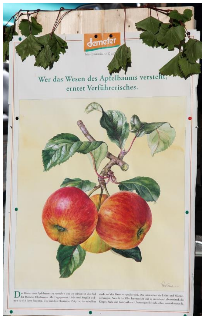
Abbildung 1: Wer das Wesen des Apfelbaumes versteht, erntet Verführerisches

von Siegfried Dombrowsky, Joachim Helms, Dr. Olaf Anderßon